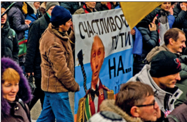
Іл. 3. Протестувальники з антипутінським банером 01.12.2013 р.

Також учасники маршу несли великий банер із портретом В. Путіна на тлі російського триколора та написом російською мовою «Счастливого пути на...», який того ж дня вивісили на конструкції ялинки на Майдані Незалежності (іл. 3).